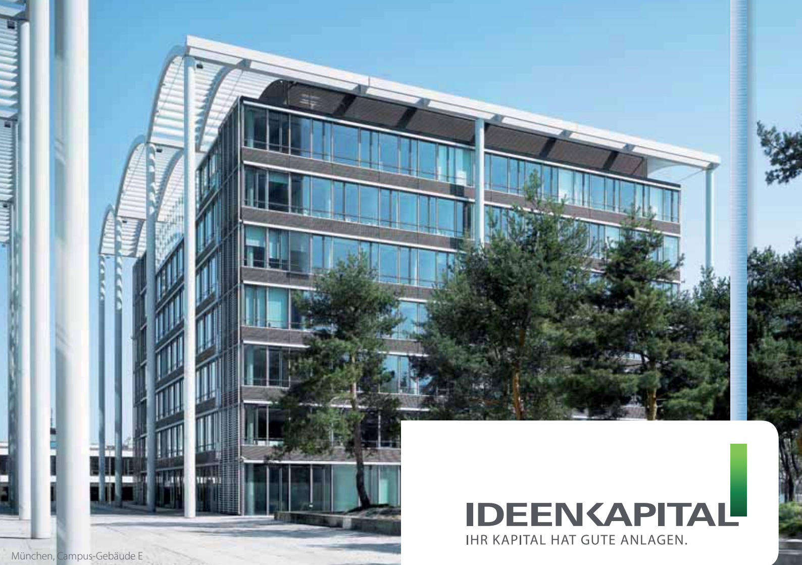
München, Campus-Gebäude E

IDEENKAPITAL IHR KAPITAL HAT GUTE ANLAGEN.