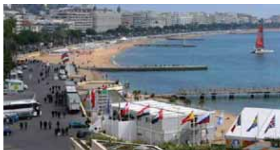
Mipim 2010: An die Croisette kamen in diesem Jahr weniger Deutsche als noch 2009

Letztes Jahr blieben dann 40% bzw. 12 000 Besucher zu Hause. 2010 soll dann auf Vorjahresniveau geblieben sein. Es wurden wohl wieder 18 000 Tickets verkauft. Zum Thema Preis oder Verschenken gab es Gerüchte. Der brutale Einbruch fiel nur quantitativ auf. Einheitlicher Tenor war, dass auf GF-Ebene jeder gewünschte Gesprächspartner anwesend war. Lediglich im journalistischen Gesprächskreis, oft auf der zweiten Ebene, hatte sich im Vorfeld der Messe eine überraschende Häufung dringend notwendiger Tätigkeiten ergeben, die Präsenz in Deutschland erforderten. Allerdings gab es Mega-Matadore der letzten Jahre, die durch Budgetsitzungen „überrascht“ wurden, so dass leider kaum jemand für Fragen nach investierten Milliarden zu finden war.